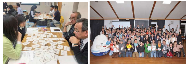
ポイントカード導入事業ワークショップ

その他の取組として、行政・企業・地域住民が起業家を応援するイベント『地域クラウド交流会』を3回にわたり実施。累計参加者は約400人に到達し、事業プレゼンを行った合計15名の起業家のうち、半数以上が出店・新規事業を実現、あるいは具体的な準備をしている。更に起業家応援のためのクラウドファンディングには本ポイントカードが利用され、町内消費と起業支援の両立が実現している。